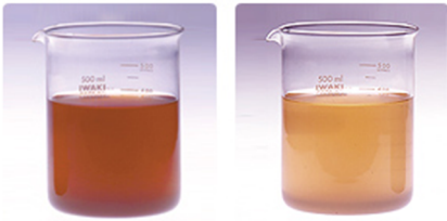
10年洗っていない布団