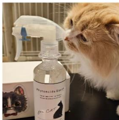
くりまるくん (サイベリアン)

我が家の全自動トイレに シュッシュしました。 特に💩したあと、においが！ 不思議なくらいにおいが消えて、 ビックリでした！ 食事するテーブルの真後ろに、 全自動トイレ置いてるから助かります。