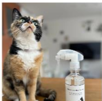
ミノちゃん (三毛猫)