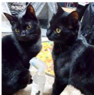
ソルクン&ルナちゃん