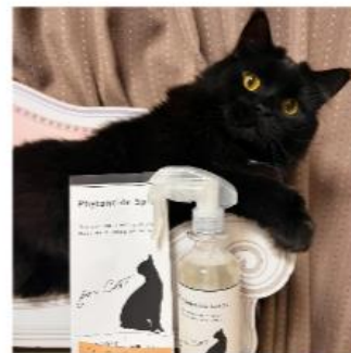
ショアくん (ラガマフィン)