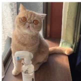
チャイクン (エキゾチックショートヘア)